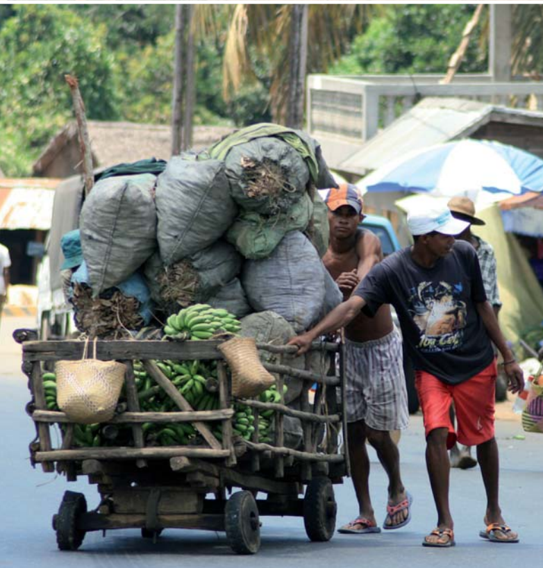
PAGINA A LATO: IL MERCATO DI ANTANANARIVO