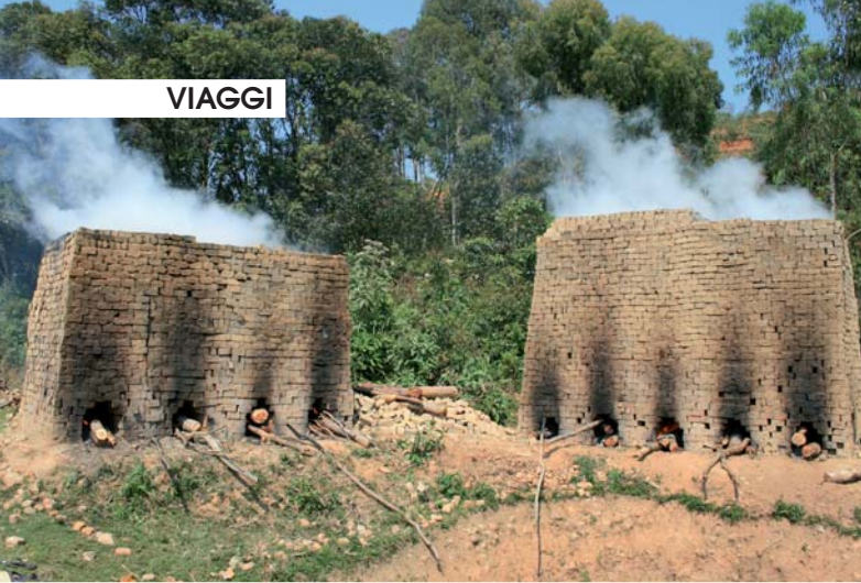
A LATO: FORNI PER LA COTTURA DEI MATTONI DI ARGILLA E PAGLIA, IMMAGINI DI VITA QUOTIDIANA E PALMA DEL VIAGGIATORE