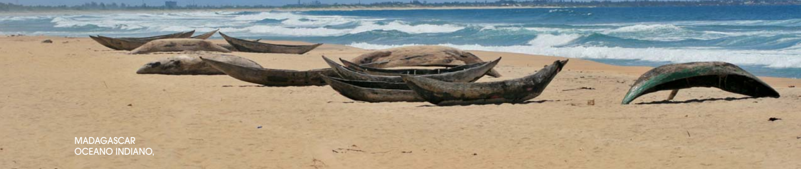
MADAGASCAR OCEANO INDIANO,