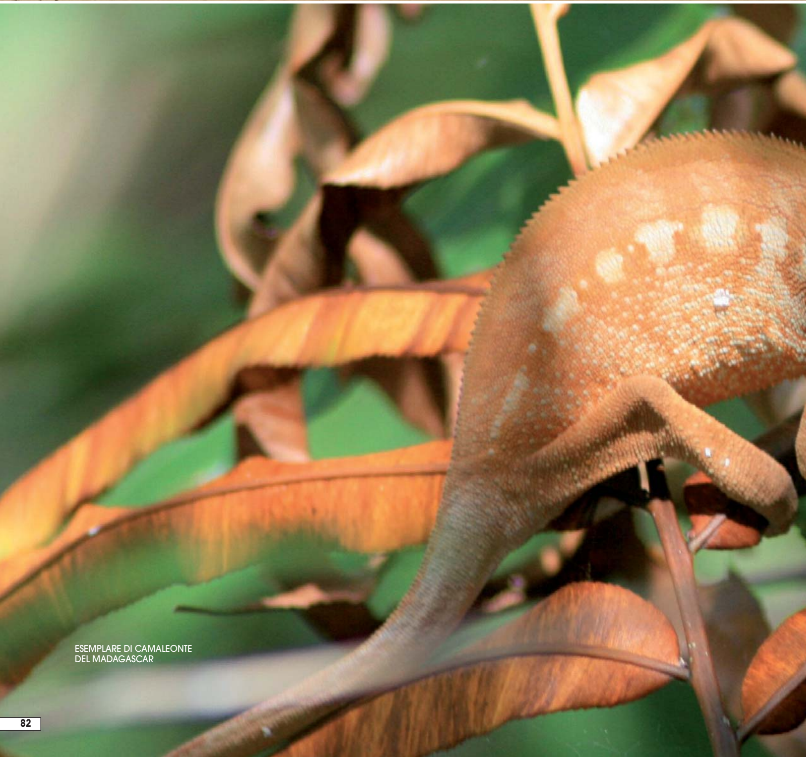
ESEMPLARE DI CAMALEONTE DEL MADAGASCAR